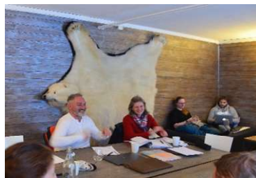
In Isfjord Radio