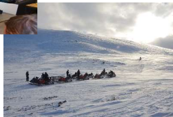
Unterwegs auf der Insel