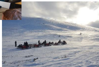
Unterwegs auf der Insel