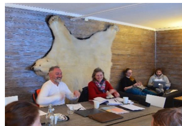
In Isfjord Radio